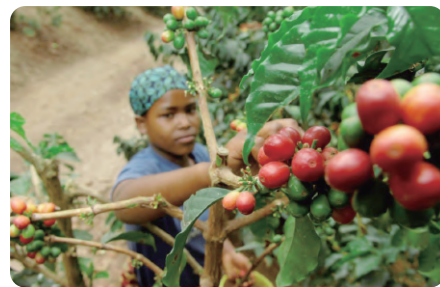
産地での収穫の様子

SDGsは「2030アジェンダ」(正式には「我々の世界を変革する:持続可能な開発のための2030アジェンダ」という文書の一部です(なので、2015年に国連で採択されたのはSDGsというより2030アジェンダです)。確かに、SDGs自体を知るためには少なくとも17の目標の文言(アイコンに添えられた短いキャッチコピーでなく、目標自体)を読むことは必要です。しかし、仮にさらに進んで169のターゲットまでしっかり読み込んだとしても、肝心のSDGsが目指す世界の姿は浮かび上がってこず、その意味ではSDGsを真に理解したことにはならないでしょう。その理念を理解するという意味では、2030アジェンダの中でSDGsの前にある「前文」や「宣言」の方がむしろ重要といっても過言ではありません。全部を読むのも大変なら、前文から宣言第9段落まで目を通すことをお勧めします(外務省による仮訳が簡単に入手できます)。前文や宣言を読むとわかるのは、SDGsは究極的には「人」のための目標であるということです。実際、宣言の中には、2030アジェンダが「人々の、人々による、人々のためのアジェンダ」であることが明示されています(第52段落)。17の目標のうち、最初の6つは「人(People)」に関するものとなっています。特に重視さ