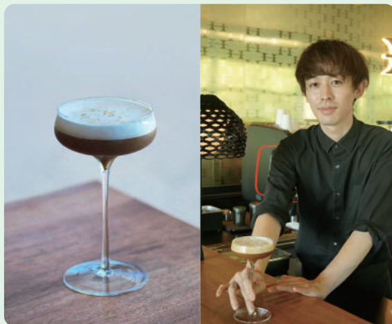
レモンとクリームのシェケラート

※「バリスタグランプリ」は日本バリスタ協会 (JBA) 主催の、スキルとサービス力を競い合い日本一のバリスタを決める競技会です。