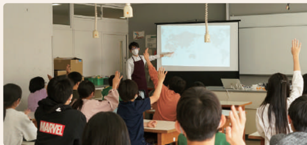
家庭科室をお借りして講習スタート。

後日、生徒30名から頂戴したお手紙には「コーヒーに興味を持った」「おいしさを知れた」という言葉もありました。今回の体験が、コーヒーだけでなく「味わうことのおもしろさ」への興味・関心を喚起させるきっかけに繋がったと思うと嬉しい限りです。